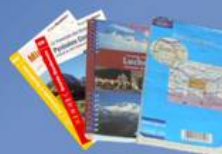
Topo-guide, carte IGN