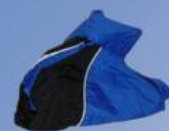
Vêtement de pluie