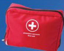
Trousse de secours