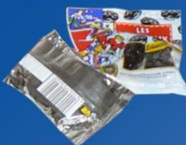
Vivres (fruits secs...)